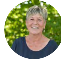
Burgi Mörtl-Körner 2. Bürgermeisterin Bündnis 90/Die Grünen