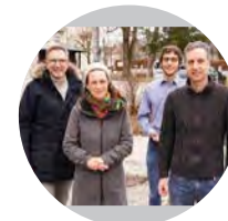
Vorstand „Traunsteiner Liste“