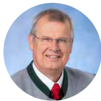
Peter Forster Fraktionsvorsitzender SPD