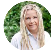
Ursula Lutzenberger Stadtrat Bündnis 90/Die Grünen