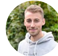
Valentin Rausch Stadtrat Bündnis 90/Die Grünen